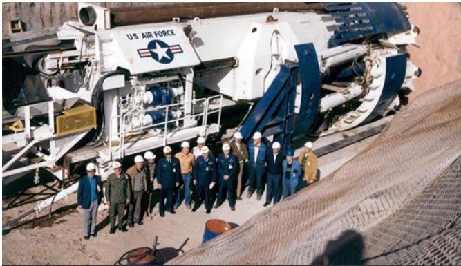
Photo d'un tunnelier de l'US Air Force prise en décembre 1982 à Little Skull Mountain, dans le Nevada.

Phil Schneider (+ 1996) était un géologue et expert en explosifs, autodidacte. Des 129 installations souterraines situées très en profondeur que l'on pense avoir été construites par le gouvernement des États-Unis depuis la Deuxième Guerre mondiale, Phil Schneider affirmait en connaître 13 pour y avoir travaillé. Deux de ces bases étaient d'importance majeure, dont l'installation de bioingénierie de Dulce, au Nouveau Mexique, qui fait l'objet de nombreuses rumeurs.