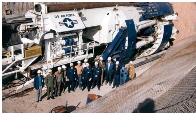
Photo d'un tunnelier de l'US Air Force prise en décembre 1982 à Little Skull Mountain, dans le Nevada (Source : U.S. Department of Energy).

Phil Schneider (+ 1996) était un géologue et expert en explosifs, autodidacte. Des 129 installations souterraines situées très en profondeur que l'on pense avoir été construites par le gouvernement des États-Unis depuis la Deuxième Guerre mondiale, Phil Schneider affirmait en connaître 13 pour y avoir travaillé. Deux de ces bases étaient d'importance majeure, dont l'installation de bioingénierie de Dulce, au Nouveau Mexique, qui fait l'objet de nombreuses rumeurs.